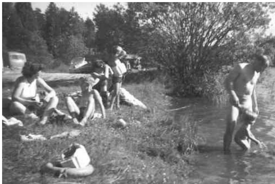
KOLBJØRNSVIKSJØEN: Badeliv ved Kolbjørnsviksjøen på 60-tallet. Bemerk svømmebeltet i forgrunnen.