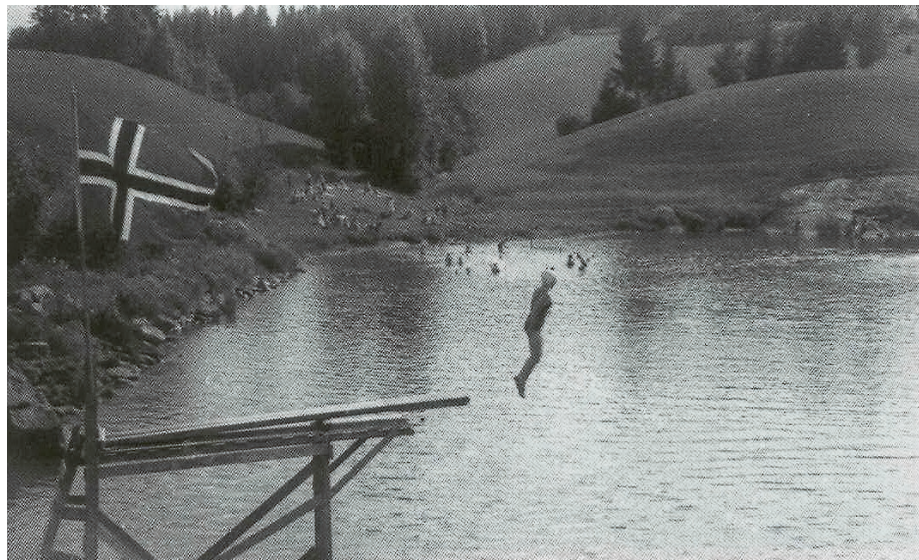
VIKELAND: Badeplassen Vikeland ved Mjørudfossen var mye brukt på 30- og 40-tallet. Dette bildet er tatt under krigen. Bemerk flagget, stupetårnet og stranden i bakgrunnen.