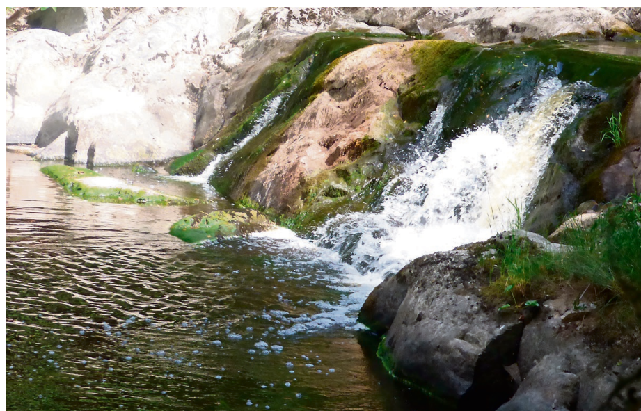
FOSSEN: Badefossen ved Høl'n slik den fortoner seg nå til dags.