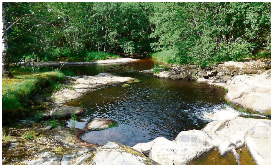
HØLEN: Klarte man å svømme over den midterste kulpen i Høl'n ble man regnet som svømmedyktig.