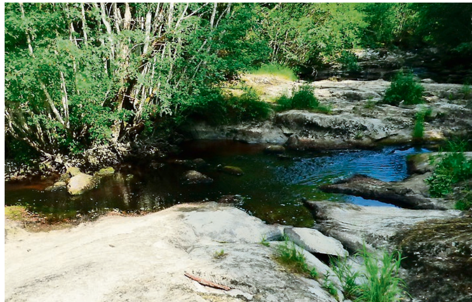
VASSEKULP: Den øverste kulpen var fin å vasse i for småunger, som gjerne trente på svømming her under oppsyn av sine foreldre.