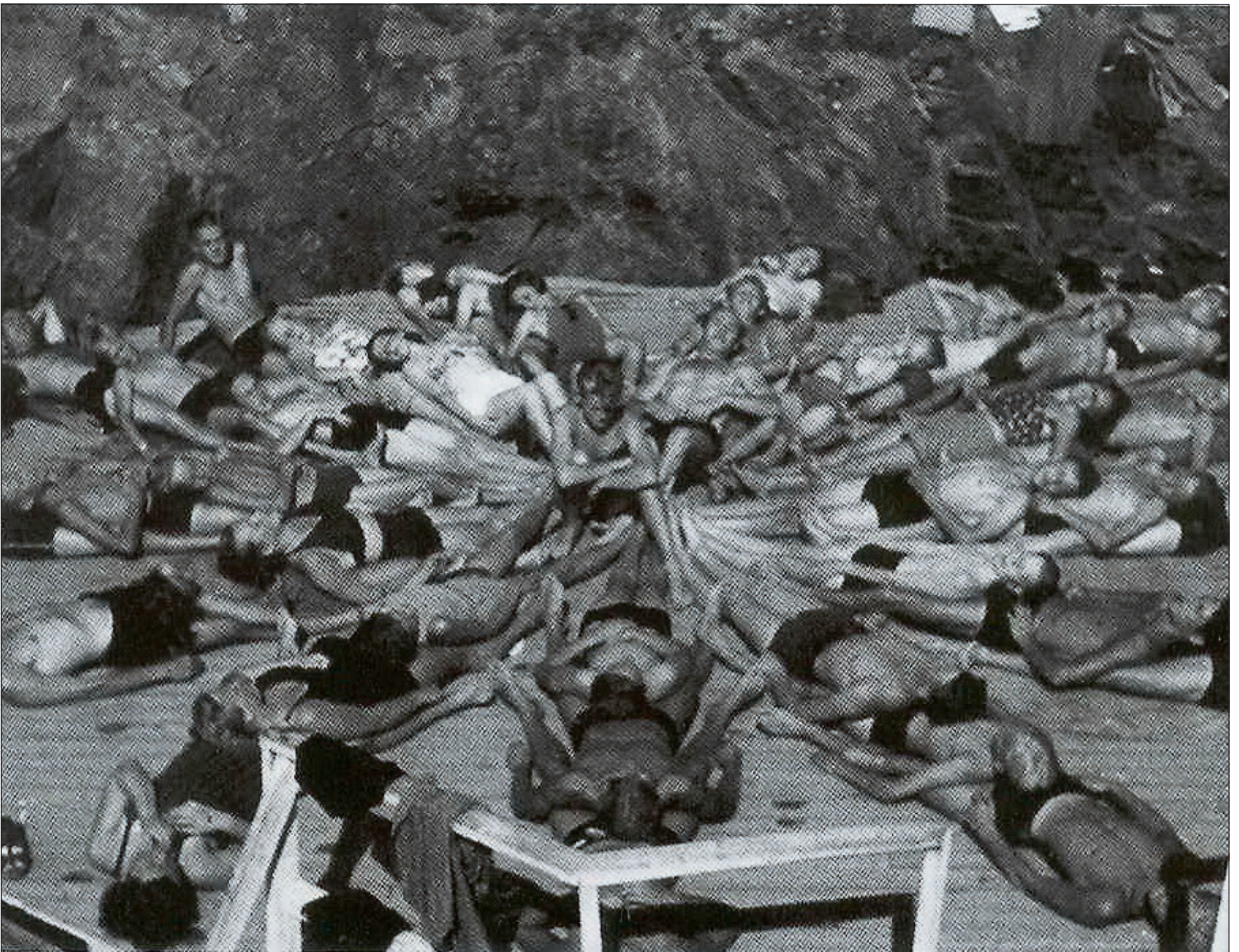
SOLPLATTFORM: Solplattformen ved Vikeland på 40-tallet. Min mor klarte å navngi flere av de som var med på bildet, og kjente igjen seg selv og min far blant de solbadende Rakkestad-ungdommene.