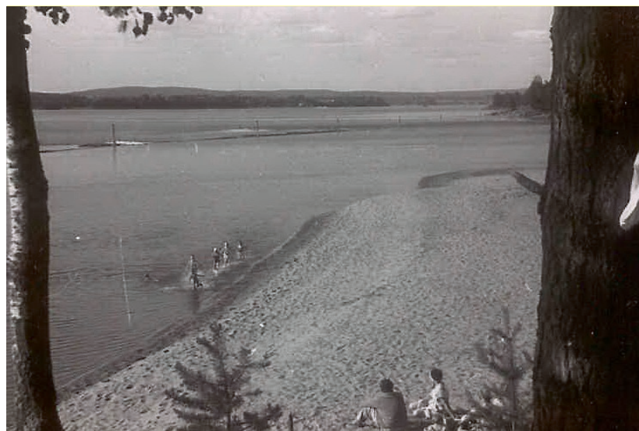
RØSÆG: Røseg-tangen ved Glomma var et populært badested på 60-tallet. Innenfor tangen lå det en lun vik som var sikker for småbarn å leke seg i. På utsiden mot Glomma kunne det være varierende strømforhold beroende på vannføring og Glommas luner, så her burde en være svømmedyktig for å bade.